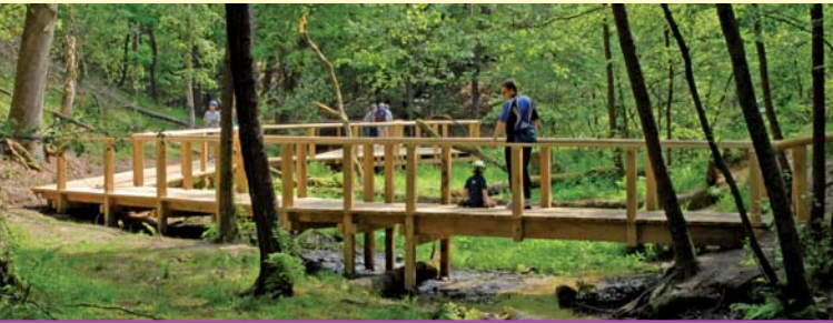
Steg an der Emsquelle