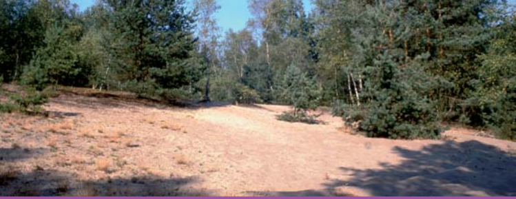
Dünenlandschaft mit Kiefernwald