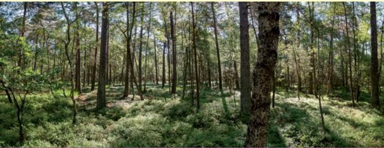
Mischwald mit Naturverjüngung