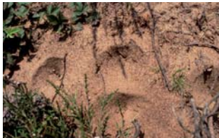
Fangtrichter der Ameisenlöwen

Flucht aus dieser „Löwengrube“ durch gezielte Sandwürfe. Fallen die Tiere hinein, schnappt er mit seinen langen Zangen zu, lähmt die Beute und saugt diese später aus. Ameisenlöwen gehören mit zu den hungerfähigsten Wesen des gesamten Tierreichs und können in aktiver Jagdbereitschaft mehrere Monate ohne jegliche Nahrungs- und Flüssigkeitsaufnahme aushalten. In der „Moosheide“ sieht man ihre Trichter an vielen Stellen, besonders in den Randbereichen der Sandwege.