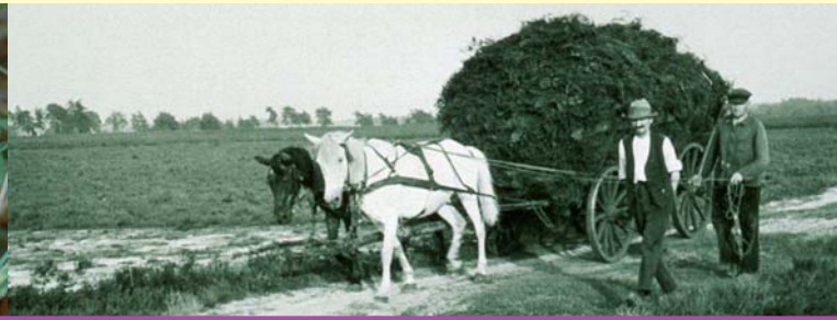
Bauern mit Heideplaggen auf dem Karren

Begleiter des Heidekrauts sind Berg-Sandglöckchen, Haarginster, Mausohr-Habichtskraut und Bauernsenf. In den letzten Jahren haben sich die Sand-Grasnelke und die Heidenelke auf den Grasheiden des Naturschutzgebietes stark ausgebreitet. Der Blütenreichtum der Gras- und Zwergstrauchheiden begünstigt wiederum ein reiches Insektenleben.