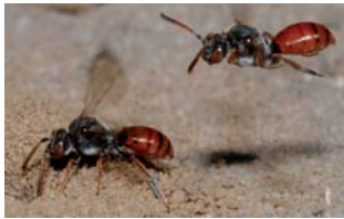
Wespenbiene (Nomada femoralis)

und somit eine zu starke Erwärmung der Pflanze verhindern.