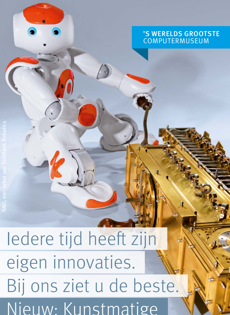
NAO, een robot van SoftBank Robotics

De informatie in deze brochure is uiterst zorgvuldig door de Touristikzentrale Paderborner Land e. V. samengesteld. De Touristikzentrale Paderborner Land e. V. is geenszins verantwoordelijk voor onjuiste of incomplete informatie.