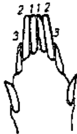
a) Frischling: Milchgebiss, 6 Schneidezähne, lang und schmal