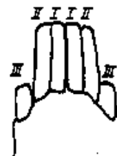
d) Überläufer ca. 22 bis 24 Monate: Die Schneidezähne sind ausgewachsen, die vier vorderen sind etwa gleich hoch und breit, II eher breiter als I und kaum angeschliffen.

Mit dem vollendeten zweiten Lebensjahr ist das Dauergebiss dann vollständig