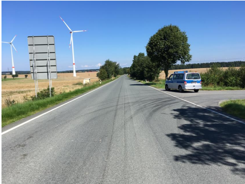
Foto oben: L 817, ca. 0,3 km nach der AS Lichtenau, mit Blickrichtung Einmündung L 817/L 754