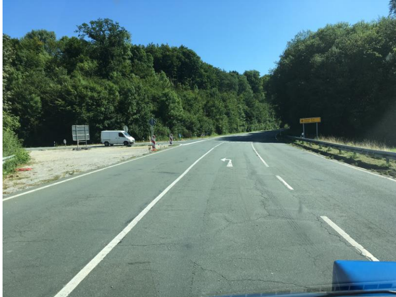
Foto oben: Einmündung L 817/L 754, links im Bild die einmündende L 754