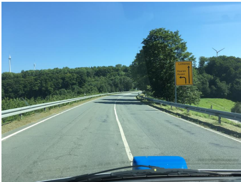
Foto unten: L 817, wenige hundert Meter vor der Einmündung L 817/L 754