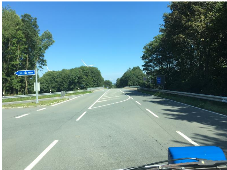
Foto oben: links im Foto die Zufahrt von der BAB 44/AS Lichtenau, aus Rtg Dortmund kommend, auf die L 817, und der "freie Rechtsabbieger" von der L 817 auf die BAB 44 in Rtg Kassel

Die Wegstrecke von der Kreuzung L 817/Fürstenberger Straße bis zur Einmündung L 817/L 754 beträgt ebenfalls ca. 2,5 km. Biegt man an dieser Einmündung (L 817 Straßenbreite hier: ca. 11 m) nach links ab, so gelangt man über die L 754 zu den Ortschaften Lichtenau-Husen und Lichtenau-Atteln.