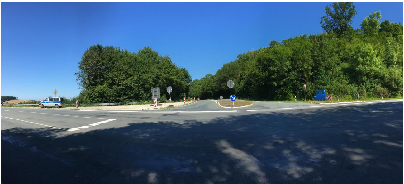
Foto unten: Einmündung L 817/L 754, links im Bild L 817 aus Rtg BAB 44/AS Lichtenau, rechts im Bild L 817 in Rtg Lichtenau, in der Bildmitte die einmündende L 754 aus Rtg Lichtenau-Husen