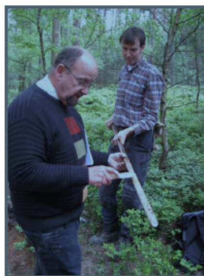
Beurteilung der Bodeneigenschaften durch den Geologischen Dienst NRW

ist und seit vielen Jahren in Nordrhein-Westfalen durchgeführt wird.